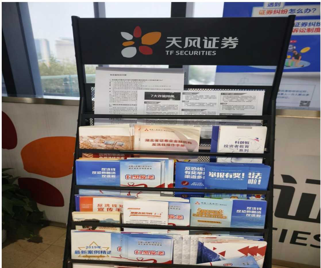
vivo X100I ZEISS, 2025