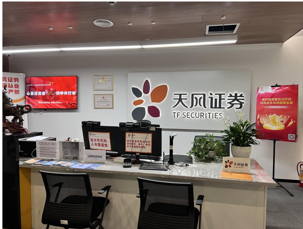
张贴海报、投教园地宣传栏、电子设备宣传