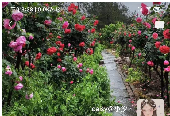
先做人，后做事。学会放下。