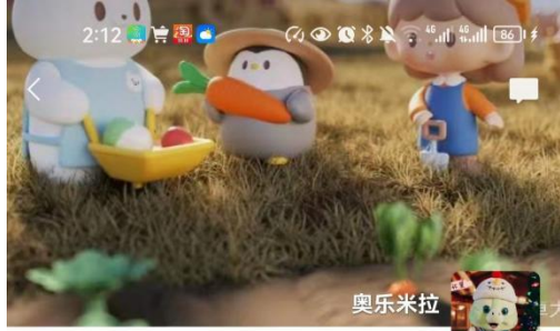
奥乐米拉 凡所发生必有利于我