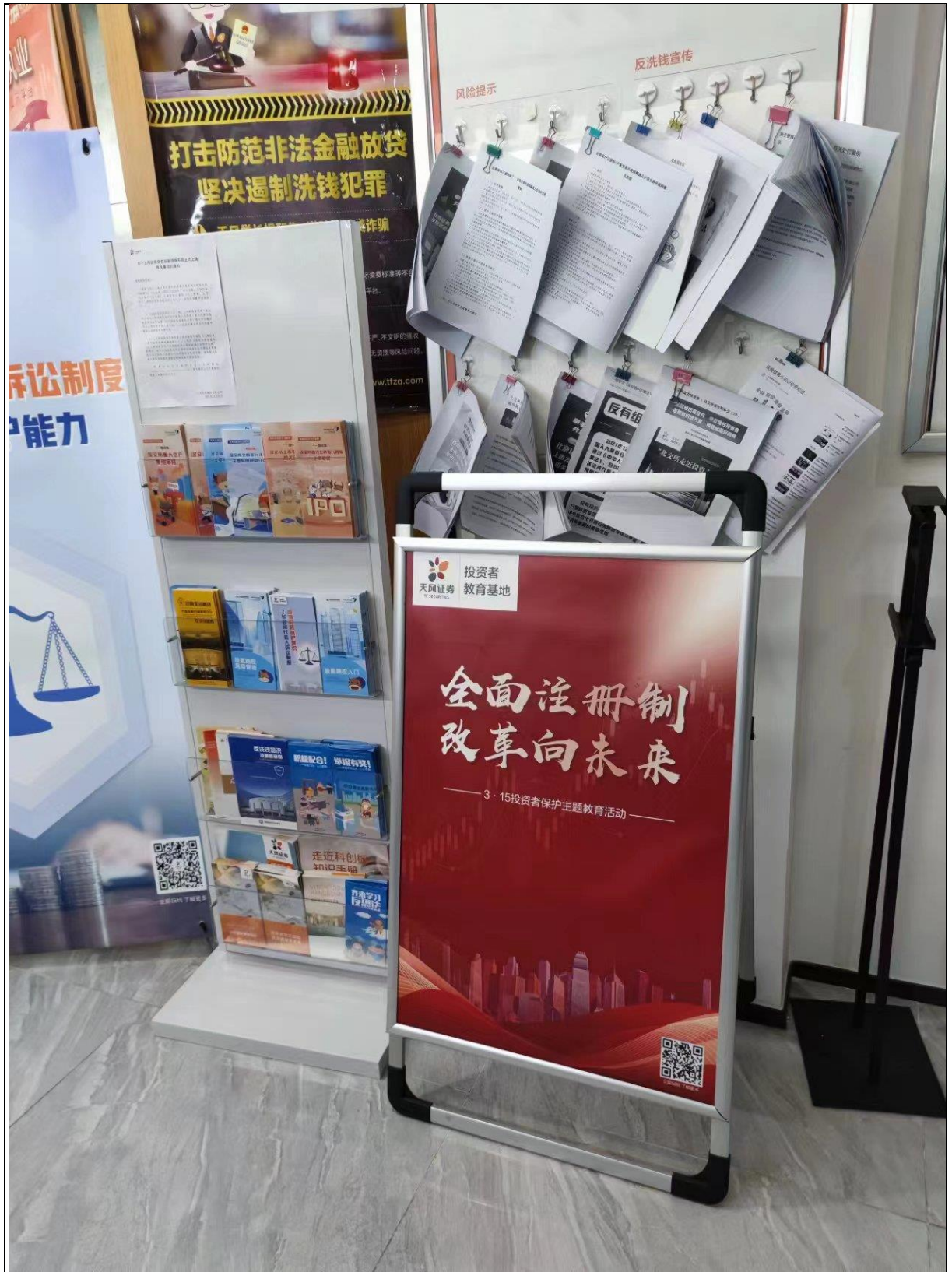
三、在营业部显著位置布置横幅，做到给客户醒目提醒