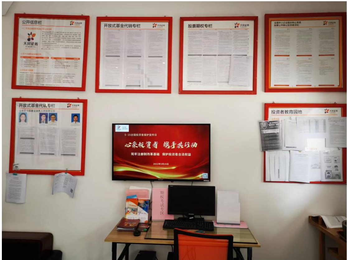
营业部外部 LED 屏宣传