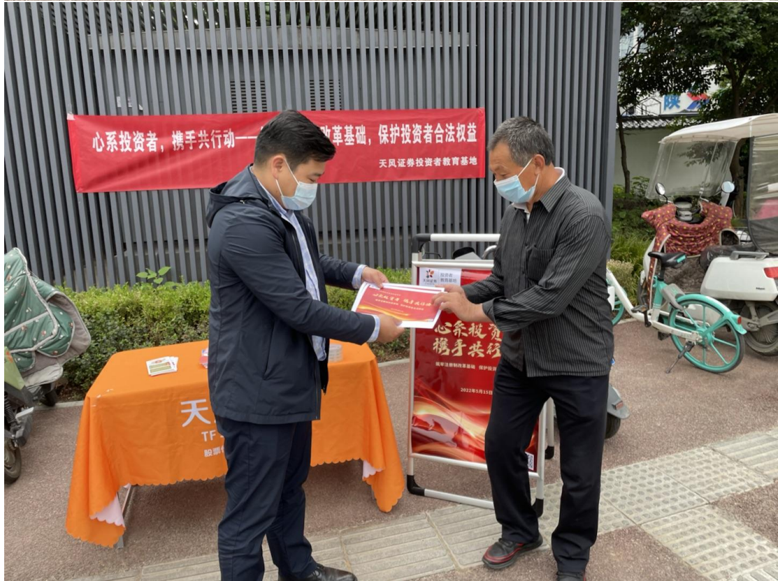
本次投教活动普及了注册制只是，帮助中小投资者更好的理解额以信息披露为核心的注册制改革，树立了理性投资、价值投资、长期