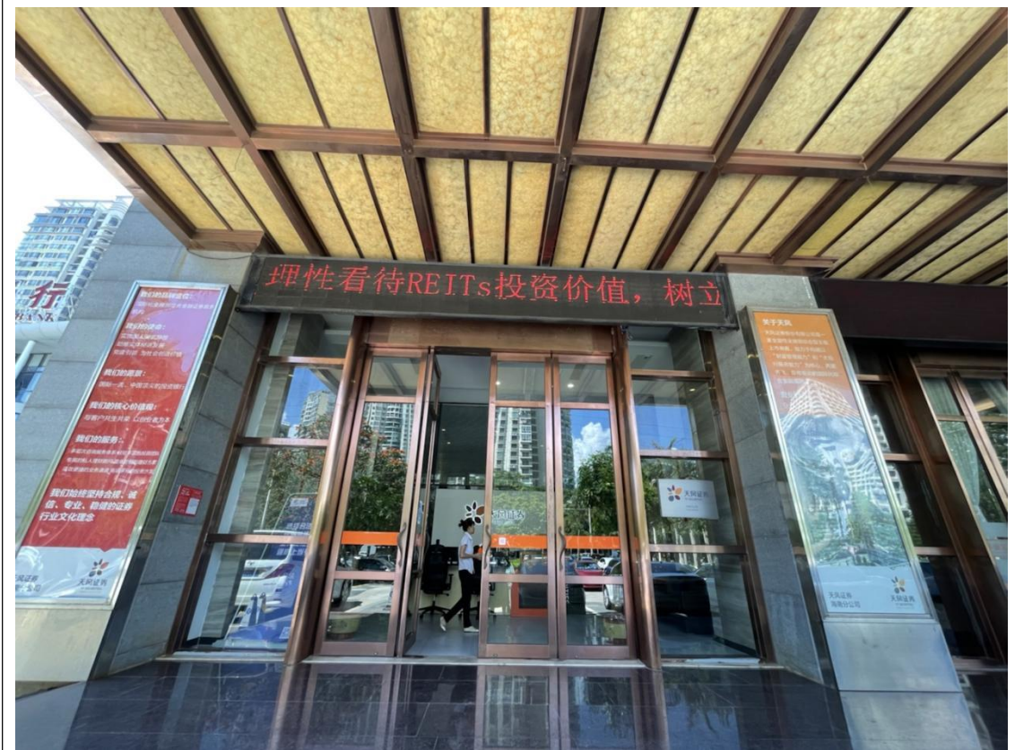
2. 室内摆台摆放宣传手册、海报