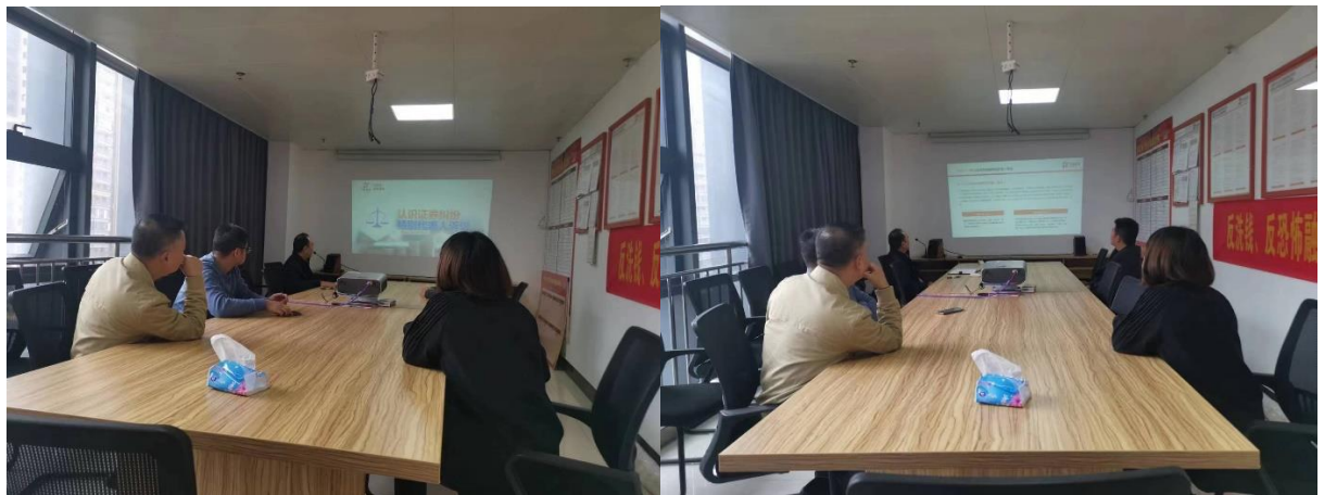
附：教育宣传活动照片

3、微信朋友圈转发“特别代表人诉讼制度”相关信息。通过微信转发“特别代表人诉讼制度”基本概念，让客户学习学习证券纠纷特别代表人诉讼制度，自觉强化风险意识和理性思维，提升合理运用维权渠道维护自身权益的能力。