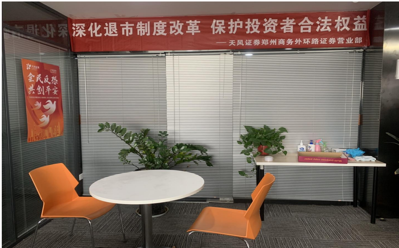
3、更新投教园地展示退市相关规则及案例