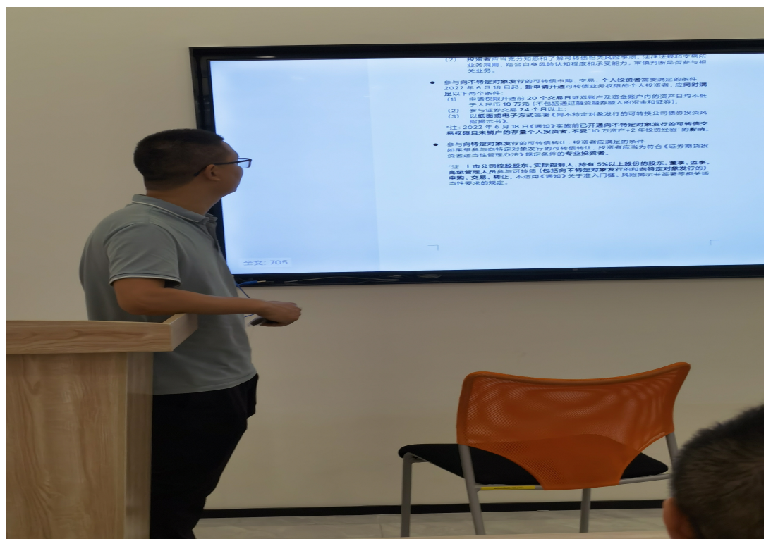
通过此次主题宣传活动，进一步引导投资者深入了解和学习可转债等相关内容。