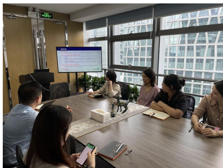
五、邀请投资者填写调查问卷