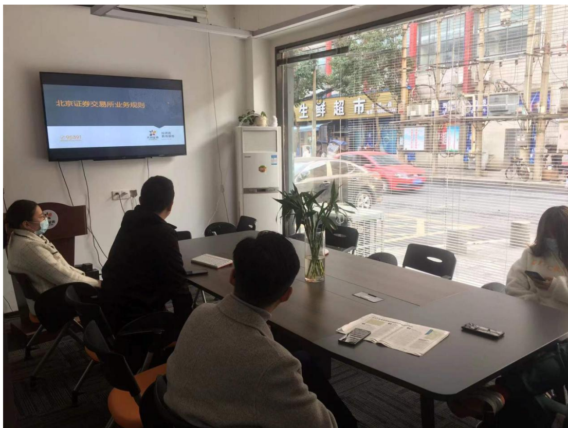
5. 文字类宣传，朋友圈，宣传材料，投教园地展示