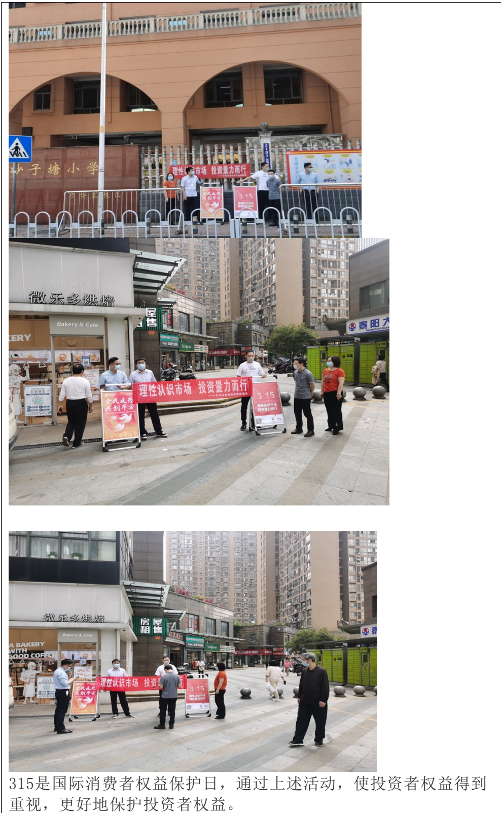
315是国际消费者权益保护日，通过上述活动，使投资者权益得到重视，更好地保护投资者权益。