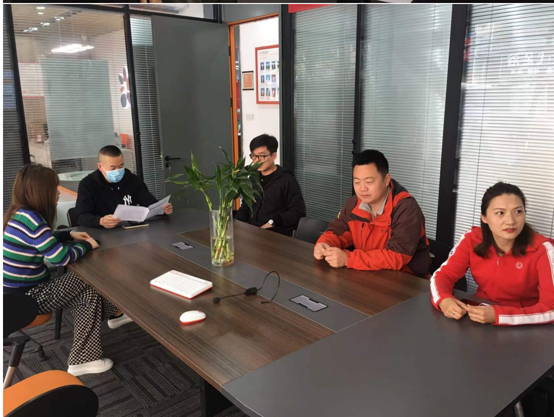
5. 员工朋友圈宣传引导