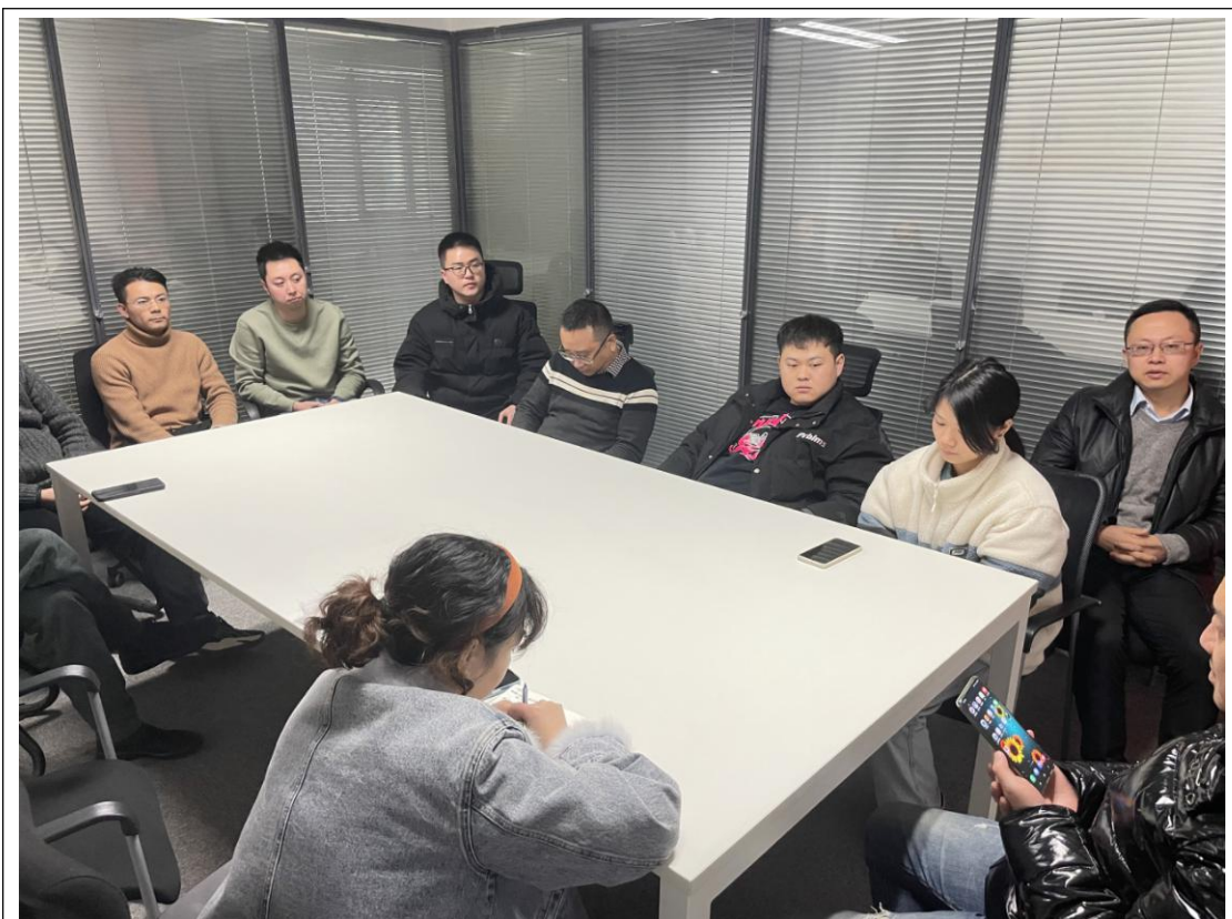
2、组织现场投资者积极参与读懂上市公司报告专项宣传投教讲座