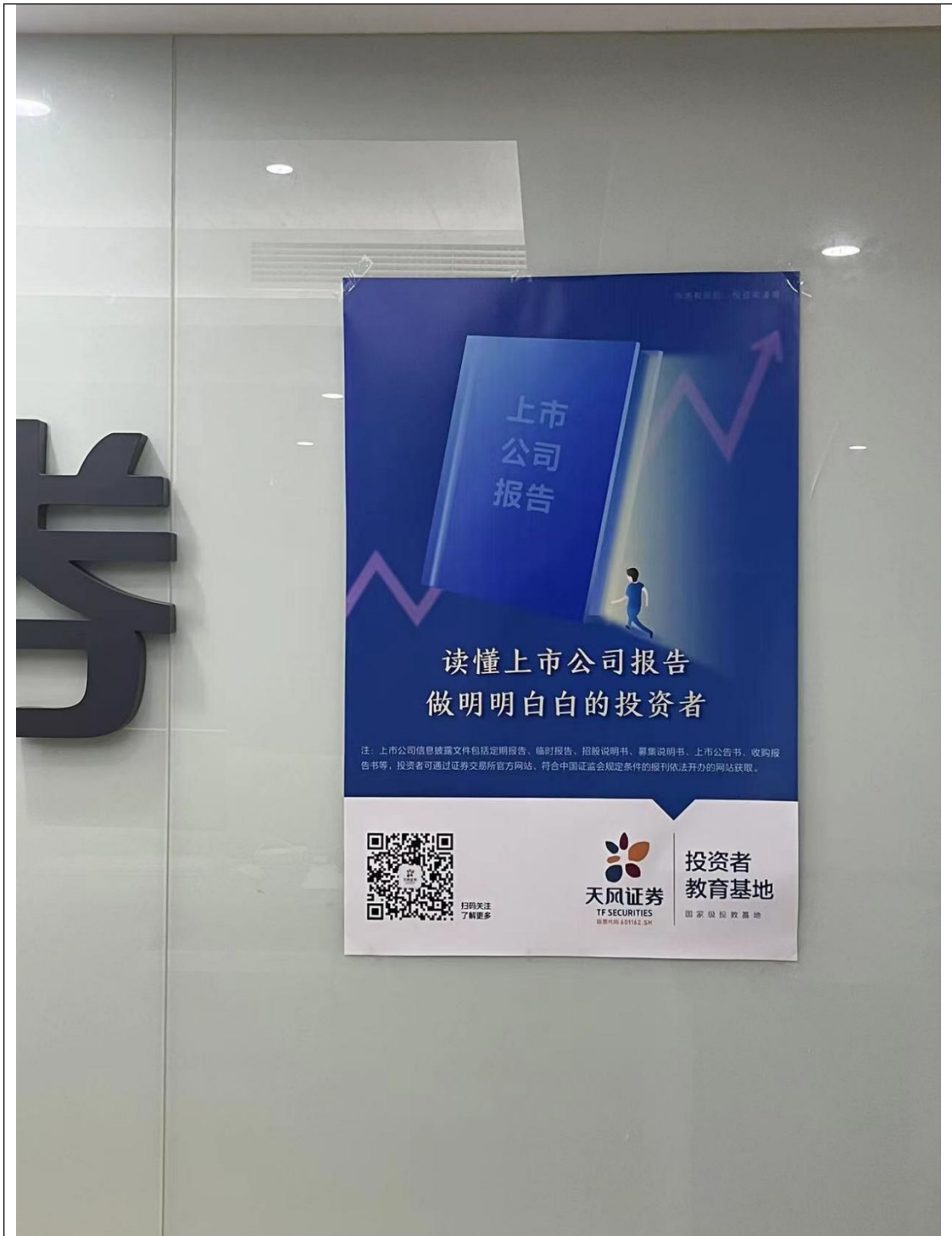
4. 客户群分享相关活动咨询