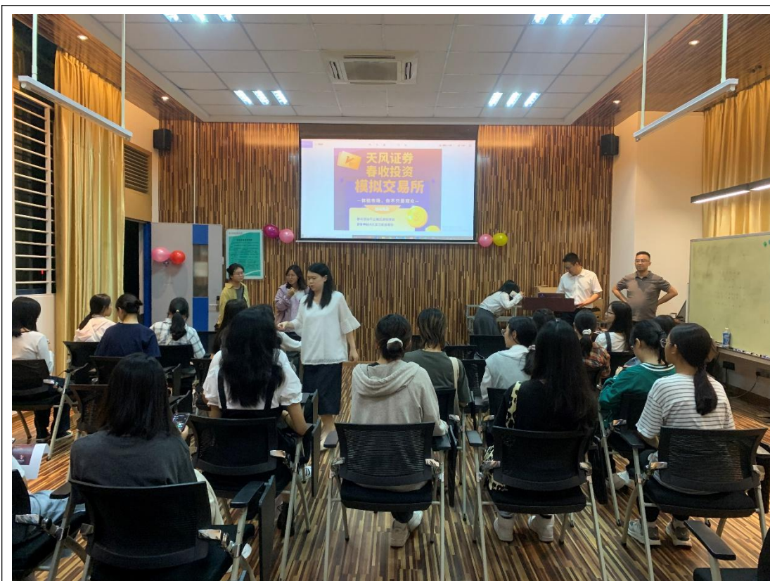
(2) 在营业部现场播放相关宣传海报。